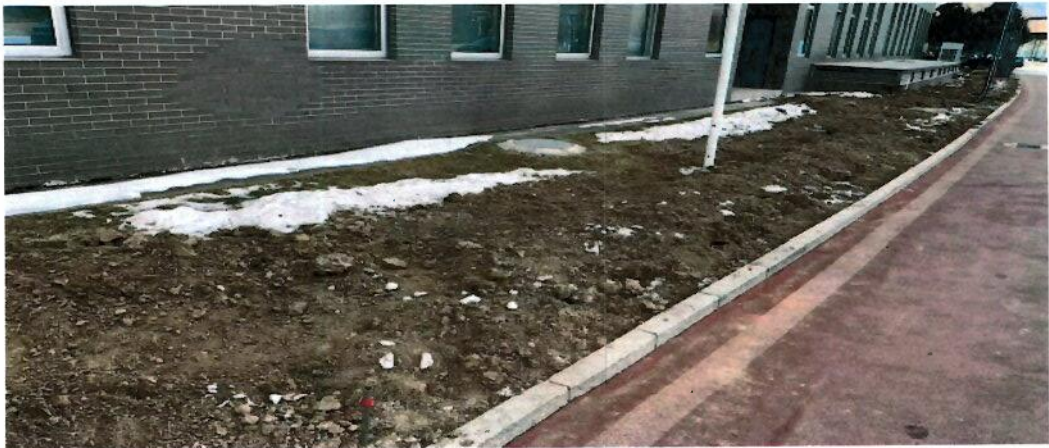
5 号楼南侧中间区域